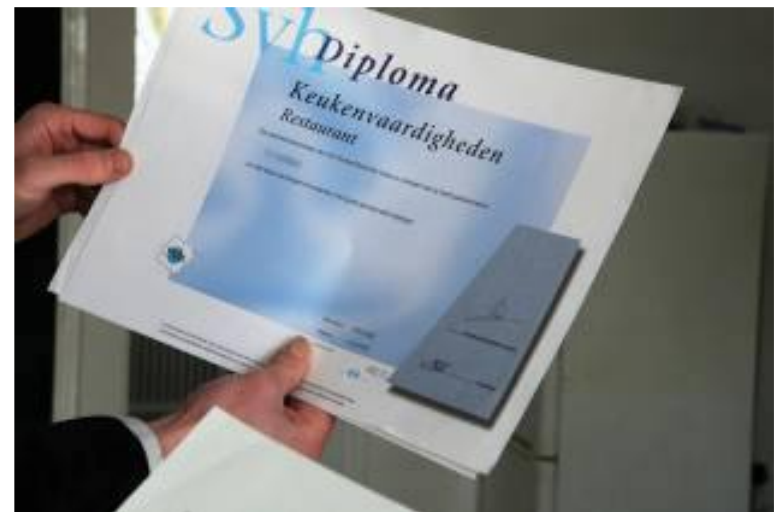
Trots op het behaalde diploma