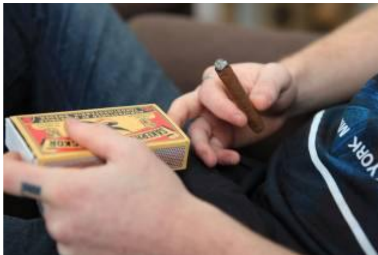
Bij een geïnterviewde thuis